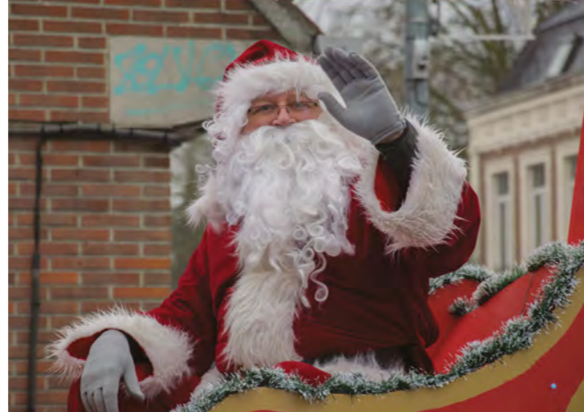
Le père Noël en ville