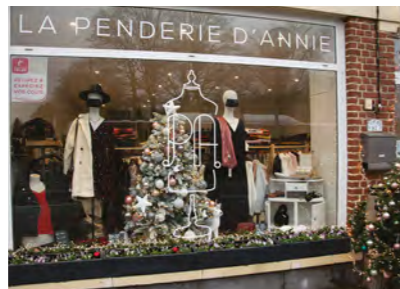
Vitrines de Noël des commerçants