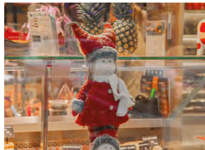
Vitrines de Noël des commerçants