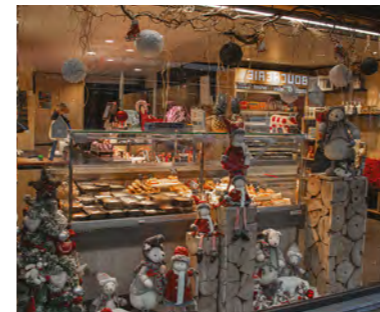
Vitrines de Noël des commerçants