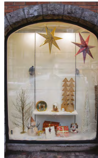
Vitrines de Noël des commerçants