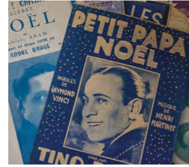
Vitrines de Noël des commerçants