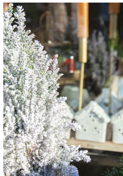
Vitrines de Noël des commerçants