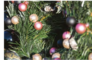
Vitrines de Noël des commerçants