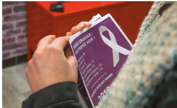
Soutien aux violences conjugales