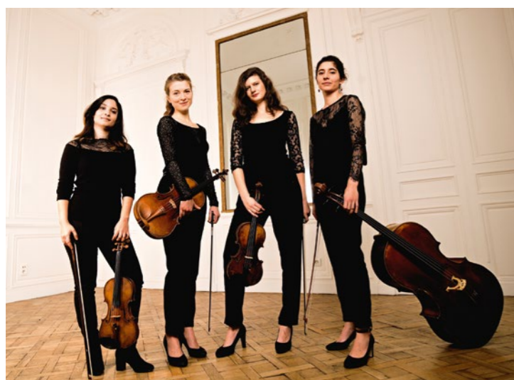
La quatuor Akilone sera présent au concert du 14 février.

C'est en 2005 qu'a eu lieu la toute première édition des Concerts de poche. Le principe ? Donner des représentations de musique classique, jazz ou d'opéra , dans des salles de proximité et à taille humaine.