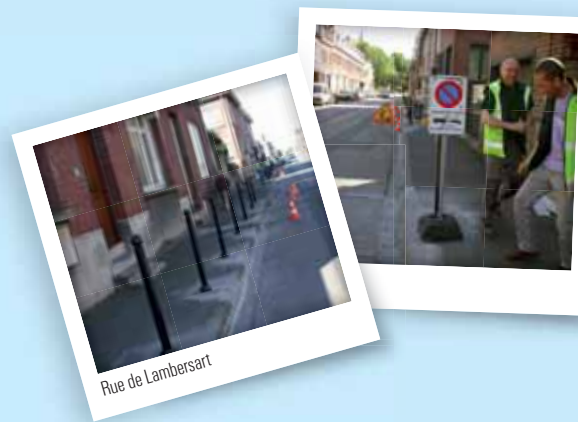
Rue de Lambersart

Un espace public correctement aménagé, c'est bien, encore faut-il le préserver : le trottoir de la rue de Lambersart entre la rue du Général-Leclerc et la rue Vauban était devenu inaccessible aux piétons. Les voitures occupaient cet espace. Des potelets de protection ont été installés pour rendre le trottoir aux piétons.