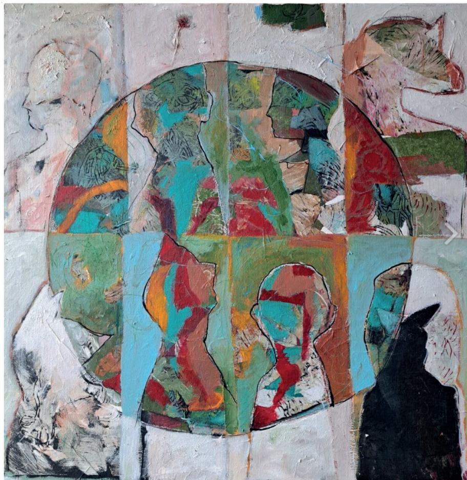
« L'Enfance » par Isabelle VENET